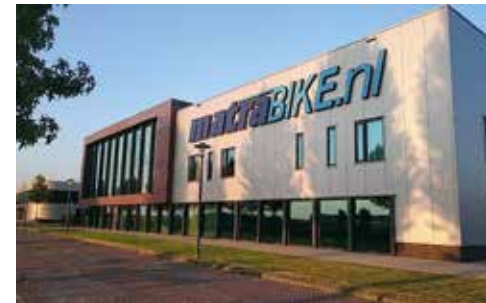
Matrabike Experience Center Waalwijk (NL)

Antwerpsestraat 83, 2840 Reet (gemeente Rumst), België. Tel. 038880990